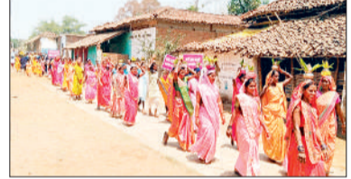
हरिभूमि न्यूज ►► राजनांदगांव